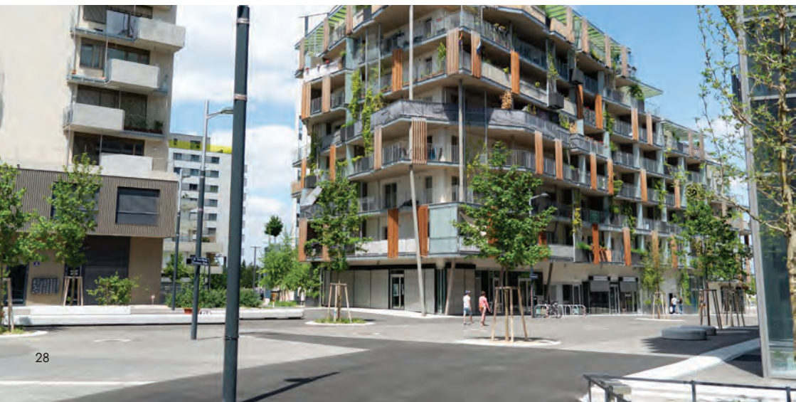
Obr.37 ▼ Komunikačný uzol vo vnútri štvrte, tiež bez áut. 📍 Anna-Bastel-Gasse, Seestadt, Viedeň.