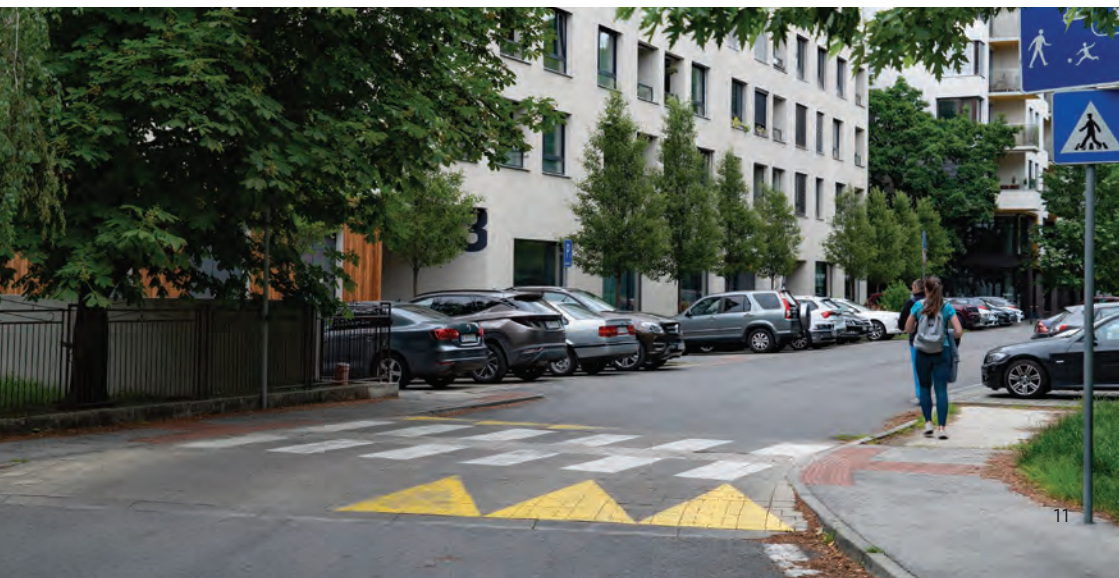
Obr.10 ▼ Vyvýšený priechod pre chodcov. 📍 Kutlíkova ulica, Bratislava.