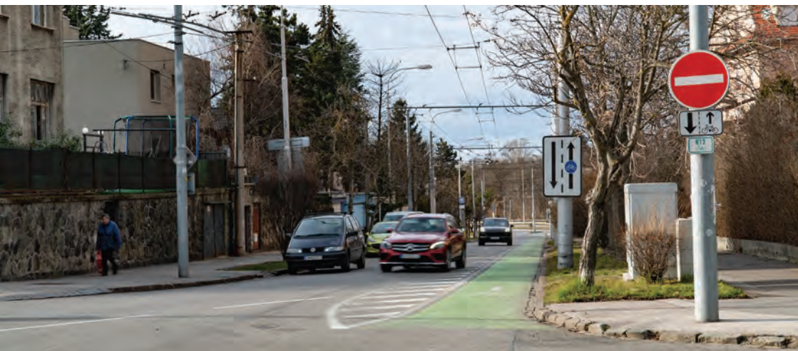
Obr.7 ▲ Vďaka širšej ulici sa na cykloobojsemku zmestil aj protismerný cyklopruh. 📍 Ulica Prokopa Velkého, Bratislava.

Nástrojom, ako motivovať ľudí využívať bicykel namiesto auta, je aj vytvorenie priamych trás pre cyklistov do ich cieľa, ktoré autá musia bežne obchádzať po dlhšej trase. Povolená jazda cyklistov obojsmerne v jednosmerkách je k tomu dobrým základom.