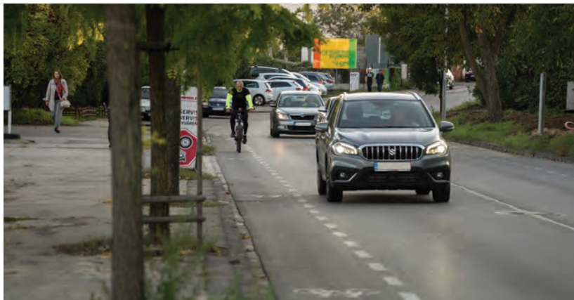
Obr.5 ▲ Ochranný pruh na širšej frekventovanej komunikácii. Sú tu ponechané (relatívne úzke) jazdné pruhy v oboch smeroch. Širšie vozidlá (nákladné, autobusy) môžu zasahovať pri prejazde aj do ochranného pruhu. 📍 Pionierska ulica, Bratislava.

Ochranný pruh sa maľuje na úkor šírky jazdných pruhov, je ho teda možné používať tam, kde sa nezmestia cyklopruhy. Za bežných okolností automobily nepresahujú svoj jazdný priestor, avšak v prípade širších vozidiel, prípadne vyhýbania sa jeden druhému, môžu prejsť aj do priestoru pre cyklistov.