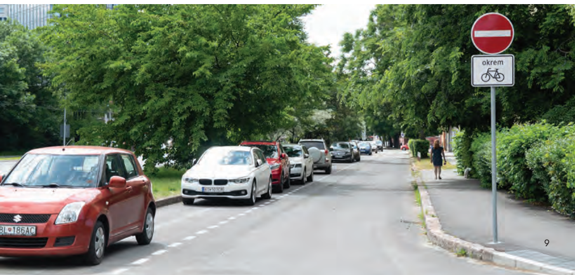
Obr.8 ▼ Cykloobojsemka v užšom priestore – bez cyklopruhu. 📍 Trnavská cesta, Bratislava.