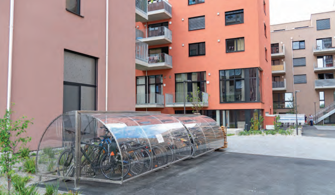
Obr.25 ▲ Zastrešené parkovanie bicyklov pre obyvateľov pred bytovým domom. 📍 Sonnenallee, Seestadt, Viedeň.

Alternatívou pri nedostatku miesta priamo v budove sú exteriérové stojiská, ktoré je tiež vhodné riešiť s prestrešením. Tie sú, samozrejme, vybavené bezpečnými stojanmi so zamykaním o rám a umiestňované v tesnej návaznosti na vstupy do objektov.