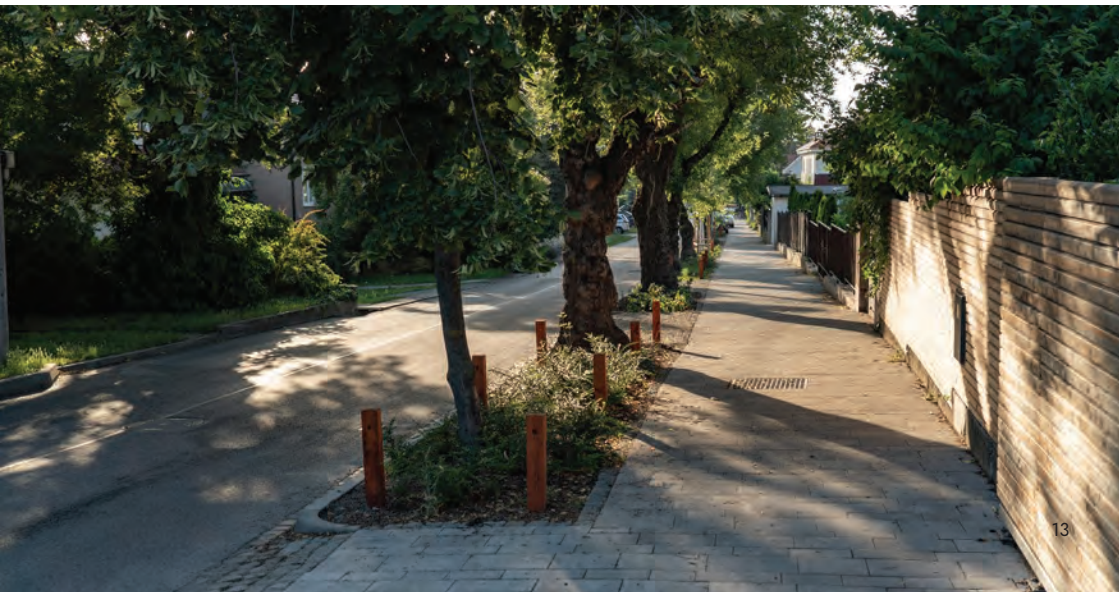
Obr.14 ▼ Chodník oddelený pásom zelene. 📍 Ulica Prokopa Veľkého, Bratislava.