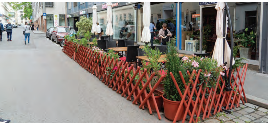
Obr.20 ▼ Parklet – konverzia dvoch parkovacích miest na terasu pre kaviareň. Významne prispieva k atraktivite a životu na ulici, okrem toho má ekonomicky výrazne väčší význam pre mesto, než dve parkovacie miesta. 📍 Andreasgasse, Viedeň.