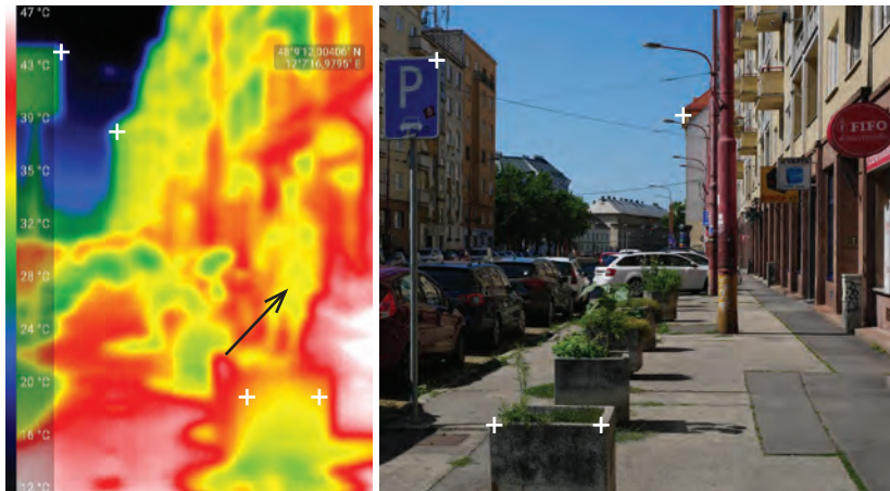
Obr.15 ▲ Termozáber ulice bez stromov, na porovnanie teplota človeka označená šípkou. 📍 Krížna ulica, Bratislava.