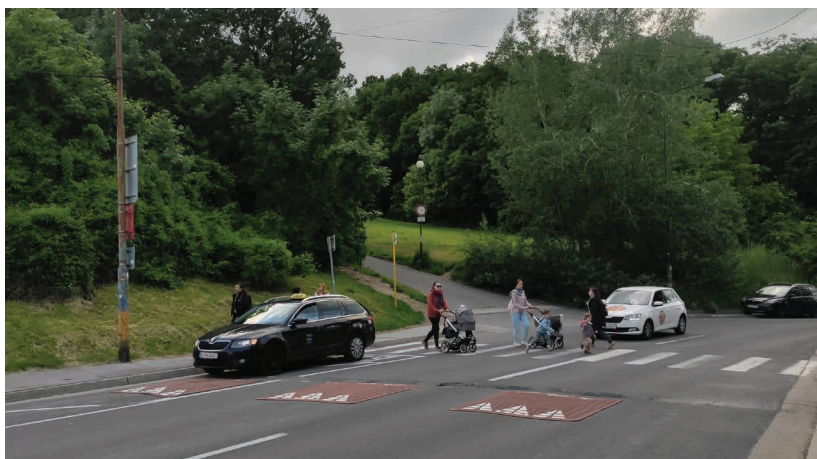
Obr.11 ▲ Dopravné vankúše sú vhodnou alternatívou na ulice s verejnou dopravou, kde ich autobusy a nákladné automobily vďaka šírke nápravy úplne obchádzajú. 📍 Kuklovská ulica, Bratislava.

Druhou skupinou sú horizontálne opatrenia, napr. šikany, dláždený povrch, zmenšené rádiusy zákrut či zúženia jazdných pruhov. Na vodičov a aj na samotné vynučovanie MPR pôsobia jemnejšie. Najvhodnejšie je kombinovať ich spolu s vertikálnymi opatreniami.