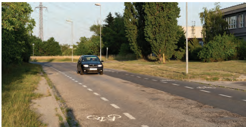
Obr.6 ▲ Ochranný pruh na menej frekventovanej, obojsmernej komunikácii ponecháva iba jeden stredový pruh pre autá. Tie sa v prípade, že idú z oboch smerov, vyhýbajú do ochranného pruhu. 📍 Polianky, Bratislava.