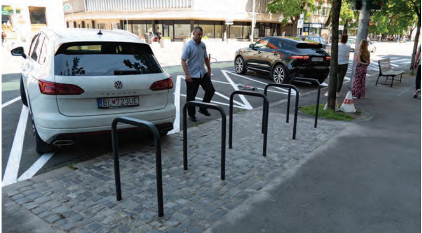
Obr.21 ▲ Bezpečné U-stojany pred občianskou vybavenosťou. Lahko prístupné, priamo na ulici. 📍 Námestie SNP, Bratislava.

Bezpečné bicyklové stojany sú tie, o ktoré sa dá bicykel stabilne oprieť a bezpečne zamknúť o rám . Situujú sa v cieľoch pohybu obyvateľstva, t. j. tesne pri bývaní, práci, škole, občianskej vybavenosti či prestupných zastávkach na verejnú dopravu.