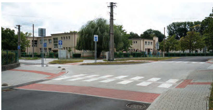
Obr.9 ▲ Vyvýšená križovatka na ulici pri škole. 📍 Školská ulica, Zohor.

Medzi efektívne prvky upokojuvania dopravy, ktoré fungujú aj po dlhšom čase (vodiči si na ne „nezvyknú“), patria fyzické úpravy v uličnom priestore. Prvou skupinou úprav sú vertikálne opatrenia, napr. vyvýšené prahy, priechody, križovatky, vankúše. Vertikálne prvky sú na spomalenie dopravy najúčinnnejšie. Je lepšie (ale aj drahšie) riešiť ich ako stavebné úpravy priamo na mieste. Vďaka tomu sú dimenzované podľa navrhovanej MPR a nespôsobujú zbytočné obmedzenia.