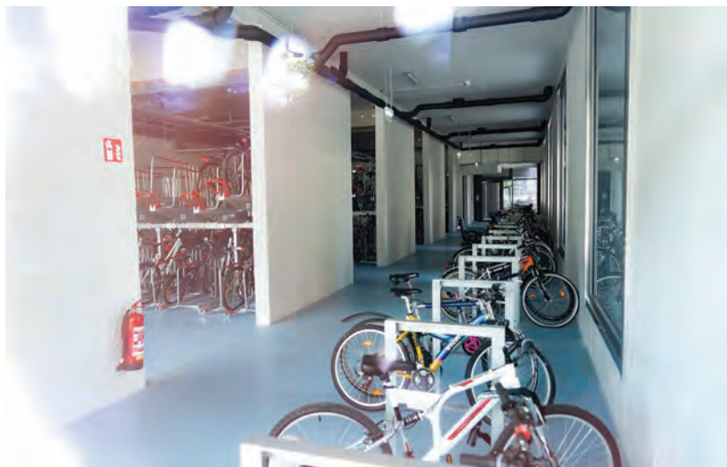
Obr.24 ▲ Pohľad do bicykliarne. Kvôli obmedzenému priestoru sa používajú dvojpodlažné stojiská. 📍 Seestadt, Viedeň.