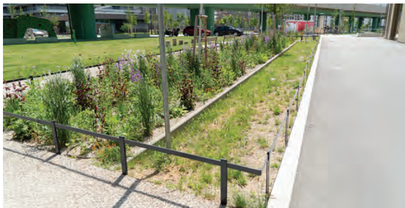
Obr.17 ▲ Vyspádovanie dažďovej vody z chodníka do záhonu. 📍 Am-Ostrom-Park, Seestadt, Viedeň.

Po príválových dažďoch prudké návaly vody nezriedka končia na zatopených uliciach či v pivniciach. Technika zadržiavania vody spočíva v tom, že pri dažďoch sa voda z nepriepustných povrchov zvedie do série povrchových retenčných jazierok, v ktorých jednak vsakuje do podlažia a jednak sa odparuje. V prípade naplnenia kapacity sa prelieva do ďalšieho jazierka v poradí, až nakoniec aj do samotnej kanalizácie (resp. do rieky/jazera). Takto zabezpečíme, že v kanalizácii končí výrazne menej dažďovej vody, a tým znižujeme pravdepodobnosť jej kolapsu. Voda ostáva v prostredí. Mimochodom, aj zelené strechy sú sami o sebe vodozadržným opatrením.