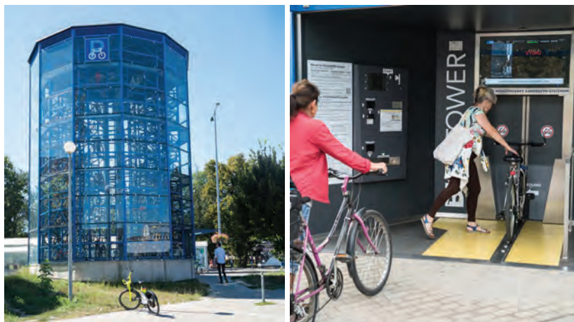
Obr.28 ▲ Výhodou cykloveže je vysoká bezpečnosť uschovaných bicyklov. Nevýhodou je jej vysoká obstarávacía cena a dlhá doba čakania na obsluženie, pokiaľ príde viac ľudí naraz (cca 30 sekúnd na jedného). 📍 Železničná a autobusová stanica, Trnava.