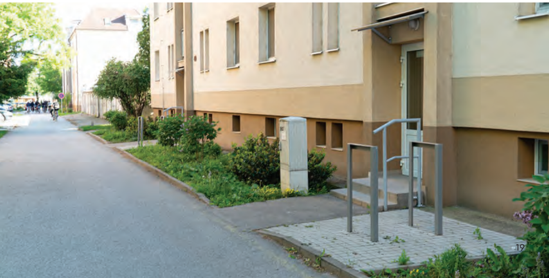
Obr.22 ▼ Stojany pre návštevy pred vstupom do bytového domu. 📍 Trnava.