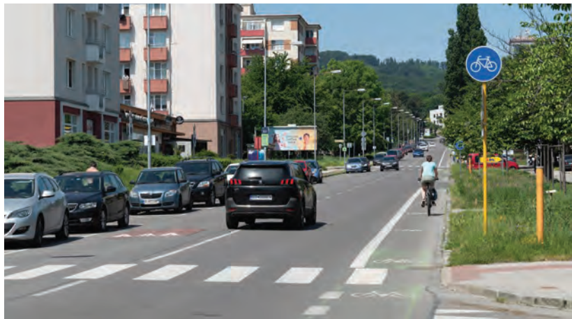
Obr.3 ▲ Cyklopruh. 📍 Pecná cesta, Bratislava-Rača.

Cyklopruh namalovaný farbou na vozovke primárne patrí na menej frekventované komunikácie v rámci miest a obcí. Vďaka rýchlosti realizácie a nízkej cene sa zvykne využívať v rámci quick wins – rýchlych a lacných riešení.