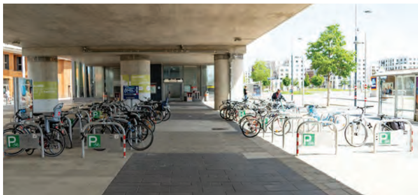
Obr.34 ▲ Prestupný uzol v centre – metro, bus, bicykle. 📍 Seestadt, Viedeň.

Parkovanie pre bicykle je tu riešené komfortným prístupom priamo na prízemí bytových domov, pozri kapitolu Parkovanie a multimodalita. Seestadt je napojený metrom na zvyšok Viedne a vlakom na Viedeň aj Bratislavu. Zastávky metra sú vzdialené do 500 m od najvzdialenejších častí štvrte, v prípade vlaku je to do 1 km. Seestadt má cieľový pomer dopravných módov stanovený na bicykel a pešiu chôdzu 40 %, verejnú dopravu 40 % a iba na 20 % IAD (individuálnu automobilovú dopravu).