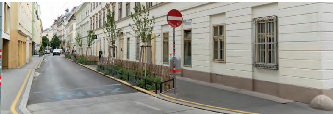
Obr.19 ▲ Konverzia ulice s parkovacími miestami na ulicu so záhonmi a stromami. 📍 Lindengasse, Viedeň.

Prítomnosť parkovacích miest v uliciach je bojom osobného a verejného záujmu. Verejný záujem je vyjadrený v parametroch ako mestotvorná či ekonomická hodnota pre mesto a práve tu vyvstáva otázka, či tie najexponovanejšie miesta na uliciach nie je vhodné alokovať funkciami, ktoré verejný záujem naplňajú viac. Na uliciach si tak nájde priestor zeleň či pobytové priestory, ktoré znížia teplotu na ulici a zvýšia jej atraktivnosť a ekonomický potenciál pre mesto aj komerčné prevádzky.