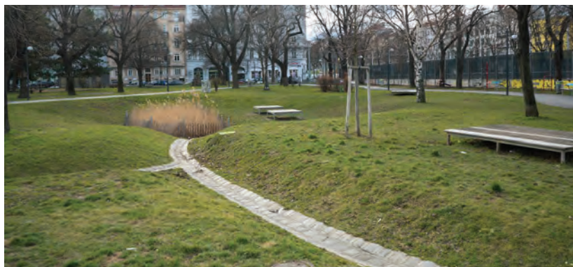
Obr.18 ▲ Vyspádovanie dažďovej vody z okolitých chodníkov do malého parčíku s veľkou kapacitou na vodu. 📍 Viedeň.