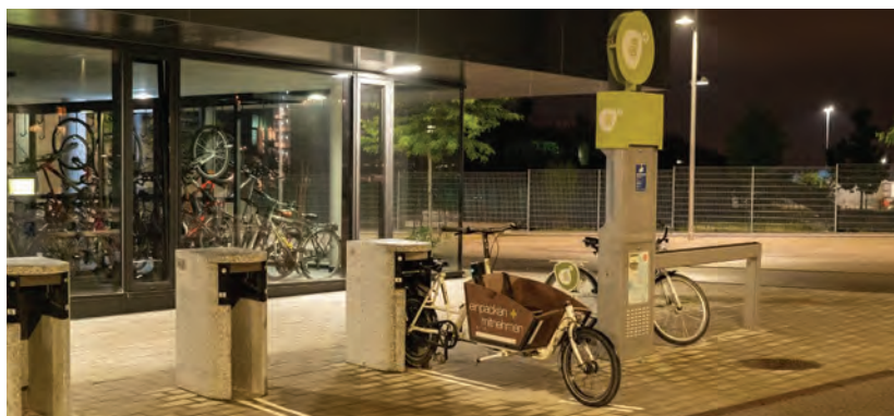
Obr.35 ▲ Požičiate si tu aj zdieľané cargo-bicykle. 📍 Seestadt, Viedeň.