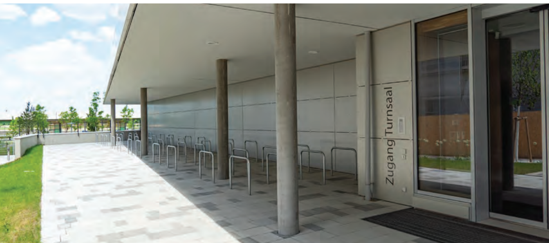
Obr.26 ▲ Zastrešené parkovanie pre bicykle priamo pred bočným vstupom do školy. 📍 Bildungscampus Liselotte Hansen-Schmidt, Seestadt, Viedeň.

Alternatívou pri nedostatku miesta priamo v budove sú exteriérové stojiská, ktoré je tiež vhodné riešiť s prestrešením. Tie sú, samozrejme, vybavené bezpečnými stojanmi so zamykaním o rám a umiestňované v tesnej návaznosti na vstupy do objektov.