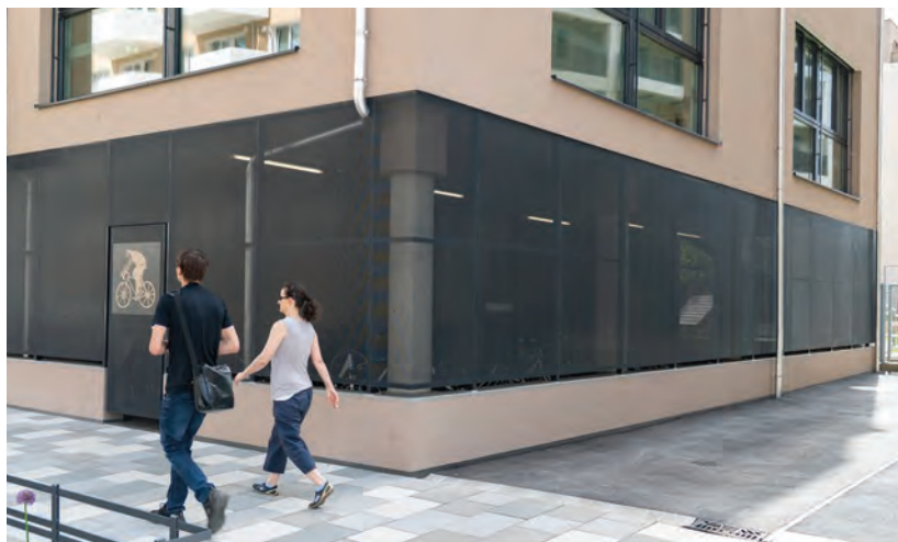
Obr.23 ▲ Aby človek použil bicykel namiesto auta, mali by sme mu poskytnúť dobre prístupné parkovanie pre bicykle – priamo na prízemí bytového domu. 📍 Ilse-Buck-Straße, Seestadt, Viedeň.

Bicyklové stojany pre obyvateľov bytových domov sa umiestňujú tak, aby bolo čo najkomfortnejšie ich využívať. To je optimálne na prízemí bytových domov, s priamym vstupom z ulice. Sú chránené jednak proti dažďu a jednak proti zlodoch aj pri dlhodobom uskladnení.