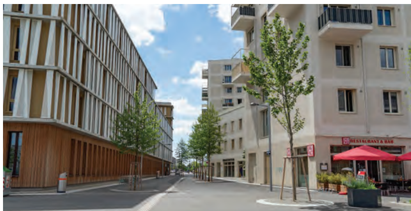
Obr.36 ▲ Ulica bez áut. 📍 Wangari-Maathai-Platz, Seestadt, Viedeň.

Riešené je to buď úplne neprístupnými vnútornými ulicami pre IAD, alebo ich zaslepením, a teda využívaním iba lokálnymi rezidentami. Parkovanie je riešené v parkovacích domoch popri vnútornom okruhu.