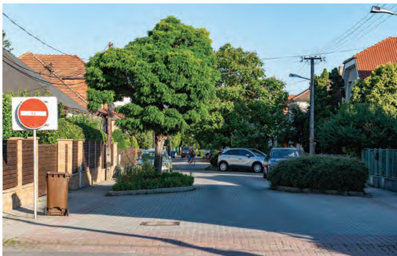
Obr.12 ▲ Rezidenčná ulica upokojená šikanami, vytvorenými zo striedajúcej sa vegetácie a parkovania zo strany na stranu. 📍 Šafárikova ulica, Pezinok.

Druhou skupinou sú horizontálne opatrenia, napr. šikany, dláždený povrch, zmenšené rádiusy zákrut či zúženia jazdných pruhov. Na vodičov a aj na samotné vynučovanie MPR pôsobia jemnejšie. Najvhodnejšie je kombinovať ich spolu s vertikálnymi opatreniami.