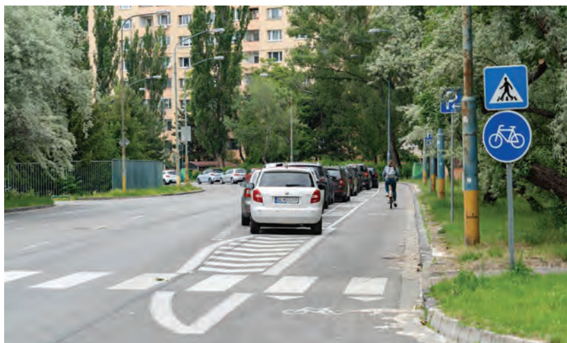
Obr.4 ▲ Cyklopruh chránený za pásmom parkujúcich áut. 📍 Mamatyova ulica, Bratislava-Petržalka.