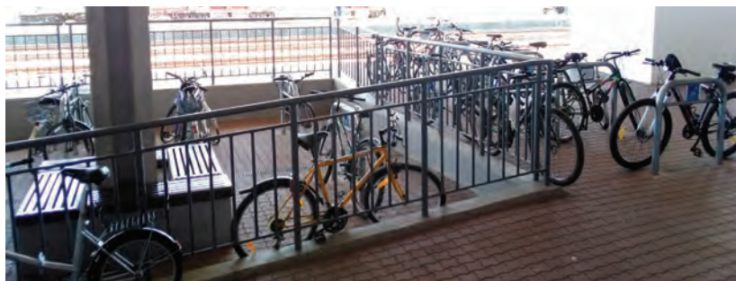
Obr.27 ▲ Optimálne parkovanie bicyklov priamo na peróne, v tesnej návaznosti na vlak. Použité sú kvalitné U-stojany priamo pod strechou, ich počet je však zjavne nedostačujúci. 📍 Železničná stanica Nové Mesto nad Váhom.

Ku atraktivnosti cyklo dopravy patrí nielen bezpečná infraštruktúra smerom na stanicu, ale aj bezpečné parkovanie čo najbližšie k prestupu na verejnú dopravu. To znamená hneď vedľa zastávky autobusu či priamo na železničnom peróne. Bezpečné stojany so zamykaním o rám bicykla už asi netreba pripomínať. Dobrou praxou je situovať ich pod strechu, aby si človek po návrate našiel svoj bicykel suchý.